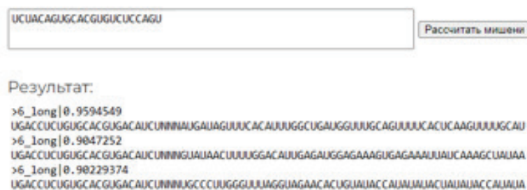
Рисунок 3. Пример запроса предсказания с выводом результата