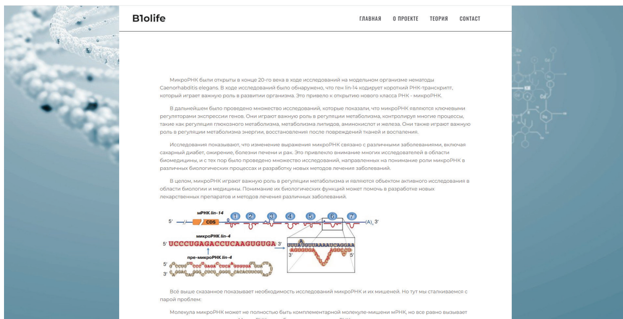
Рисунок 2. Страница с теоретическими данными